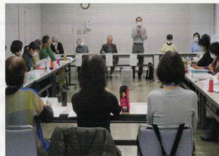
傾聴ボランティアグループとの交流