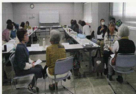
グループ別ロールプレイ