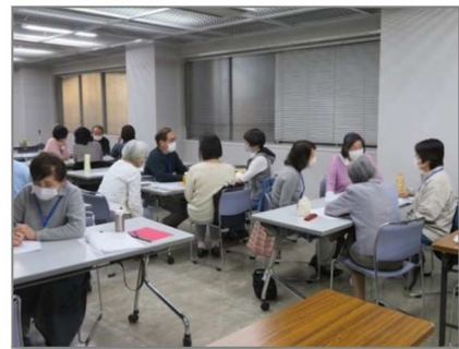
グループ別 ロールプレイング

※ コロナ感染予防策（換気・人数制限・アルコールによる手指消毒・マスク着用）を行います。